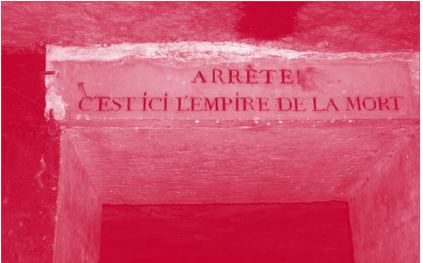
Al contrario de lo escrito en el dintel de la puerta de entrada en las catacumbas de París el lector no debe detenerse, por más que éste sea el imperio de la muerte