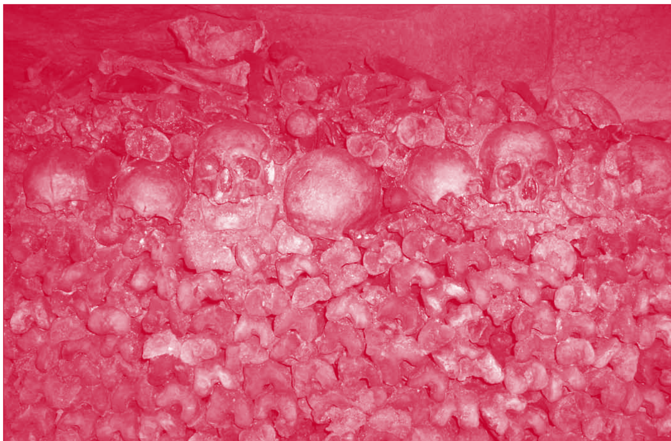
Los pintores representan a los anacoretas del pasado reflexionando a la vista de un cráneo humano. Hoy hay que bajar a las profundidades para encontrar estos detonantes de la reflexión.