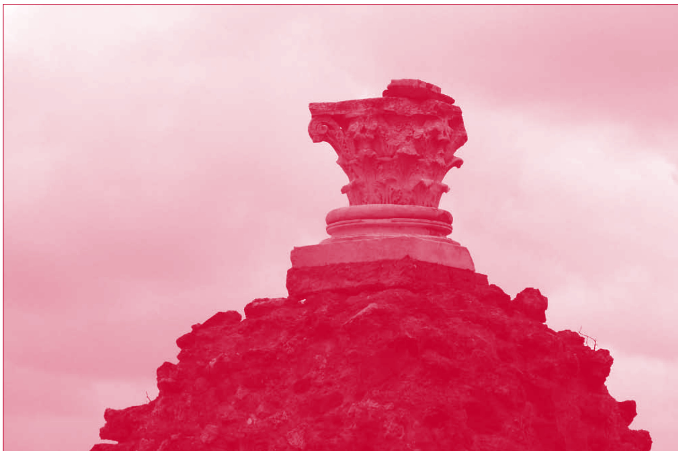
Las mudas obras de los muertos se alzan admonitorias: memento mori.