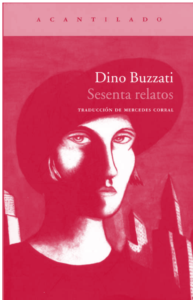
Portada con ilustración de D. Buzzati

un enfermo leve pudiera verse turbado por la proximidad de un colega agonizante y garantizaba un ambiente homogéneo en cada piso. Por otra parte, el tratamiento podía graduarse así de una forma perfecta. De ello se derivaba que los enfermos estuviesen divididos en siete castas progresivas 7 .