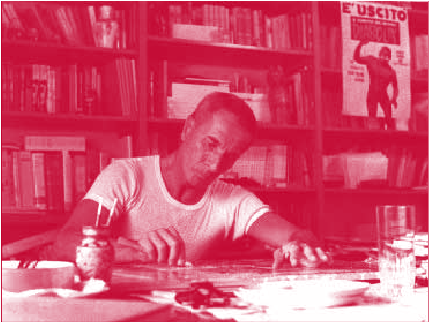
Dino Buzzati en su estudio.

templar con nitidez la “ley de vida” a que antes hacía mención. Buzzati también se ha ocupado de estas gafas, unas gafas adquiridas a un anticuario oriental que permiten descubrir a los protagonistas de otro de sus cuentos, Los viejos clandestinos 18 . El propietario de esas gafas explica su secreto al narrador: permiten descubrir la próxima muerte de alguien haciéndole aparecer como un anciano decrepito. Desde este punto de vista la vejez se convierte en algo relativo, pues el modo de pensar común, basado en una experiencia que, en el fondo, es casi solamente estadística, conduce a creer que,