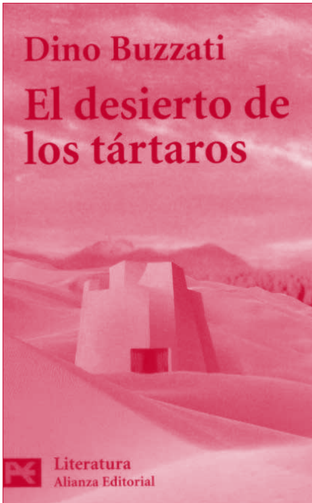
Portada con ilustración de Dino Buzzati

Según él, lo que determina el definitivo triunfo de la muerte es la inquina de los más jóvenes. Y no son los iletrados, sino los universitarios quienes se mani-