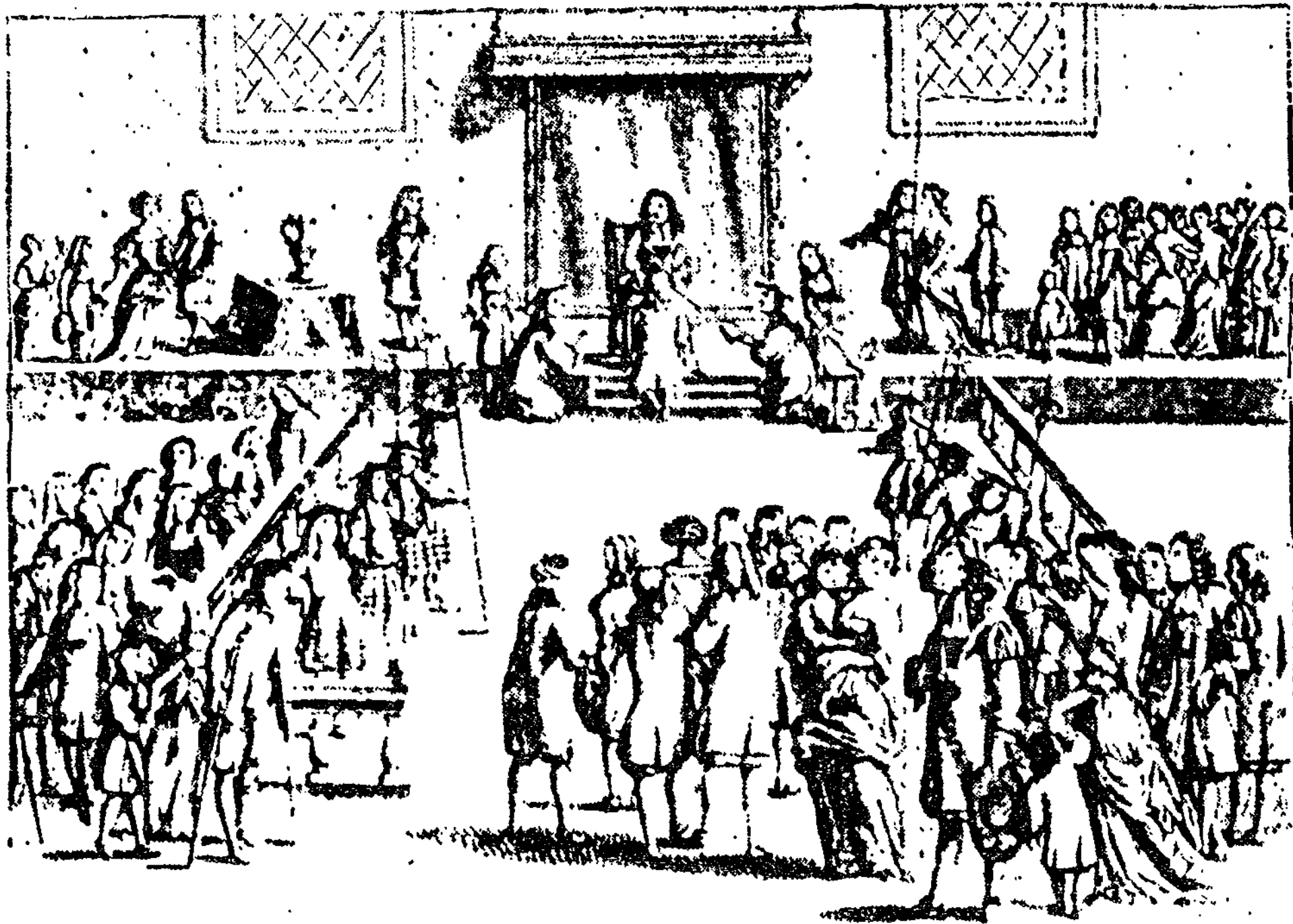
The King's Cure of the Kings-E-V-I-L.

Curación de escrofulosos por el rey de Inglaterra. Estampa del siglo XVII.