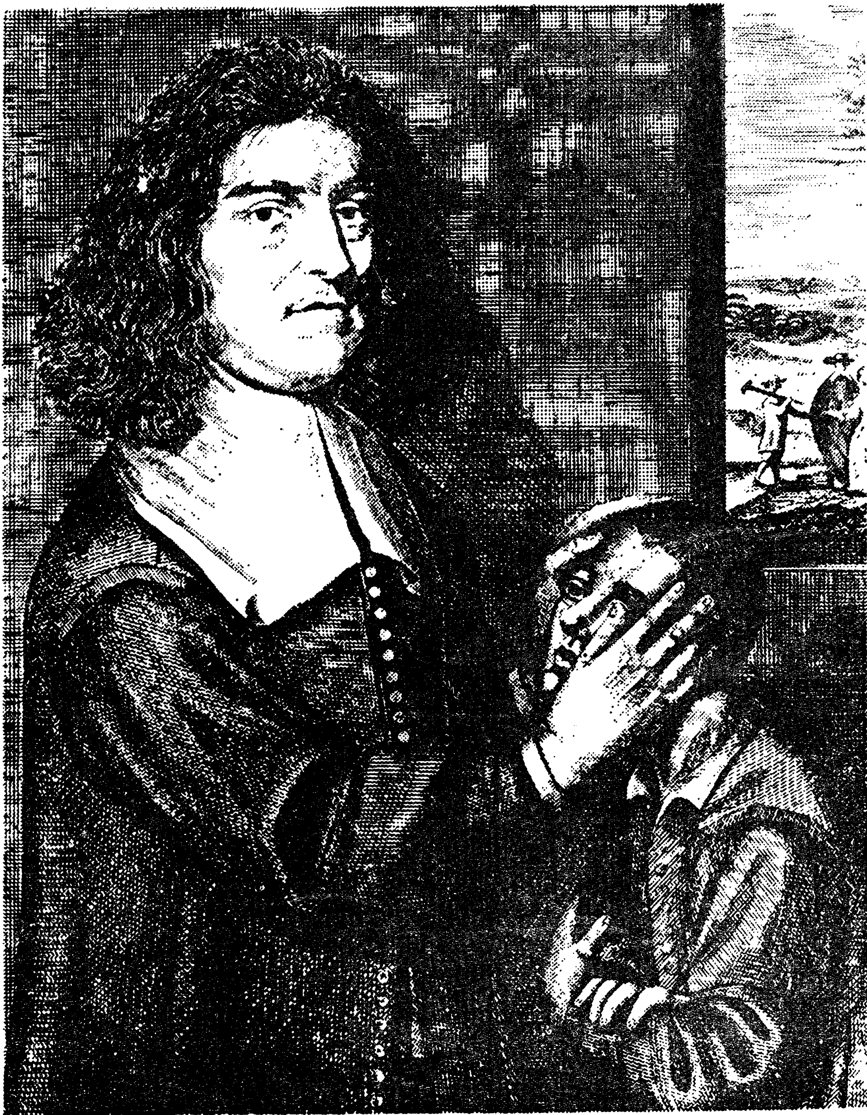
Valentín Greatrakes, famoso por curar diversas enfermedades al solo contacto de la mano.

en su espíritu ideas religiosas de tendencia mística, intenta formarse —dice él— «un corazón sencillo e íntegro para comparecer ante Dios y ante los hombres». Aunque más atento seguramente a éstos últimos y a la mundanidad que le rodea, le llega un día, de forma súbita, lo que él llama la inspiración. «Hace cerca de cuatro años —relatará más adelante— tuve un impulso, una extraña sugestión vino a mi mente, y esto me hizo pensar que... se me había concedido el don de curar la escrófula». Confiesa de paso que él no se siente capacitado para dar una explicación racional del hecho, pero esto no es obstáculo para que se lance a la aventura sin escrúpulos de ninguna clase. El primer caso que cae en sus manos es el de un enfermo con fuertes dolores y lesiones en